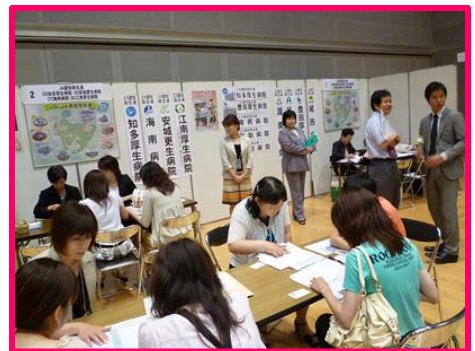
前回(第11回)看護適職フェアでの風景

0.0% 10.0% 20.0% 30.0% 40.0% 50.0% 60.0% 70.0%