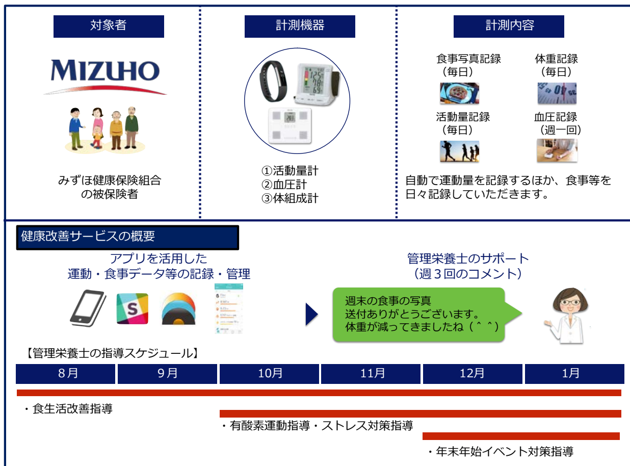
図 2：本実証事業の全体像