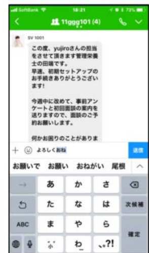
▲管理栄養士とのチャット相談が可能